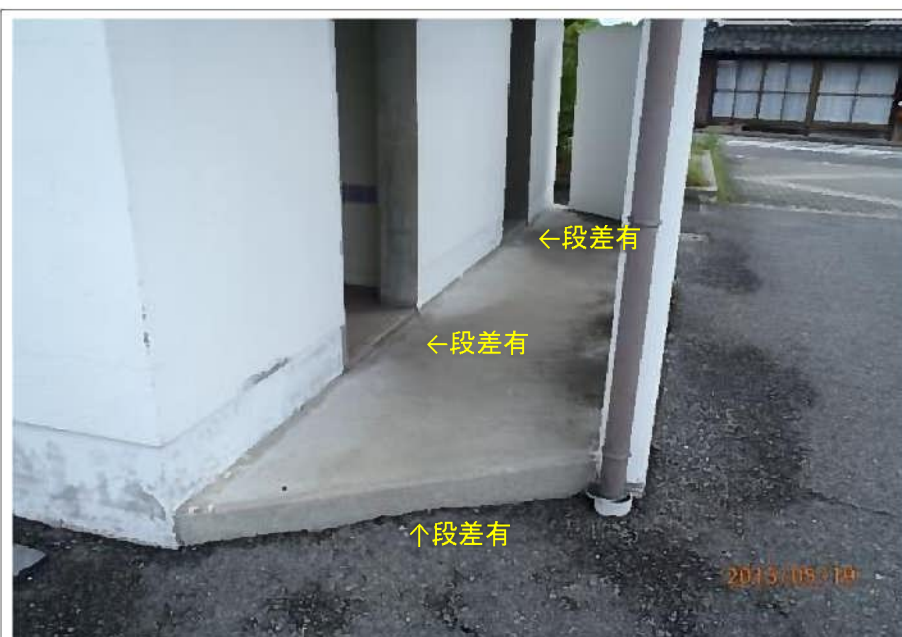
闘竜灘トイレ③ (入口段差)