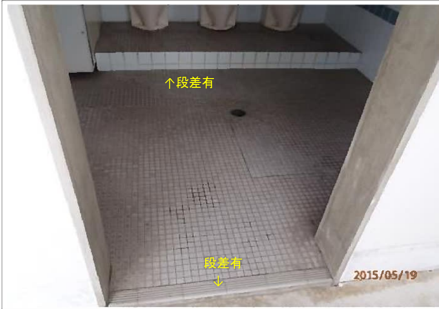
闘竜灘トイレ④ (男子トイレ段差)