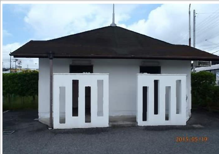
闘竜灘トイレ① (全体)