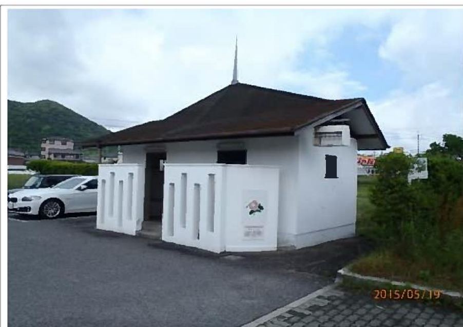
闘竜灘トイレ② (全体)