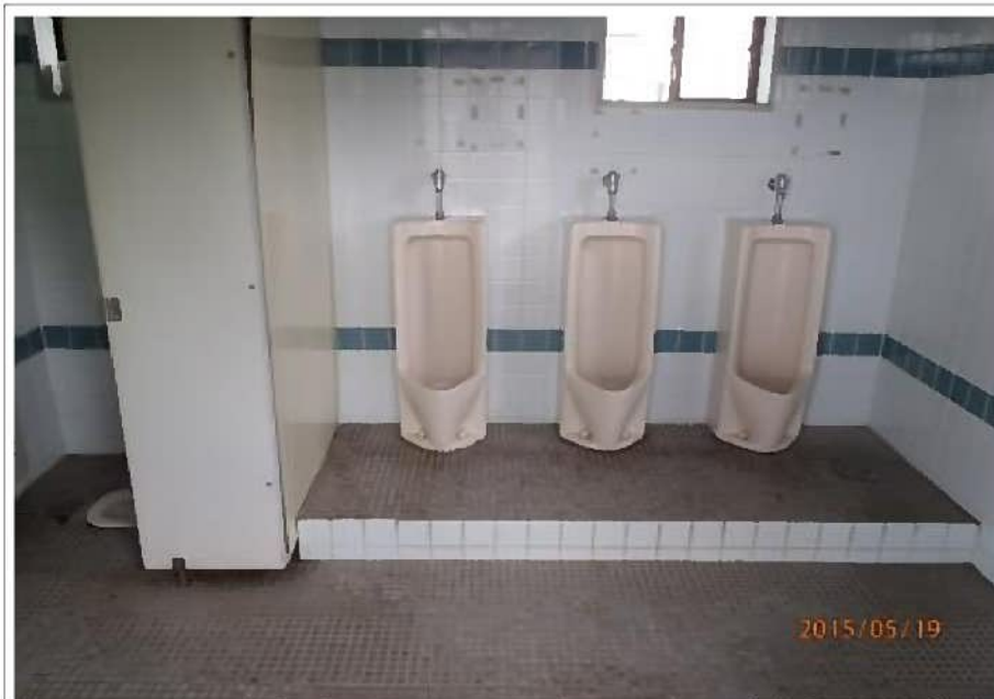
闘竜灘トイレ⑤ (男子トイレ内)