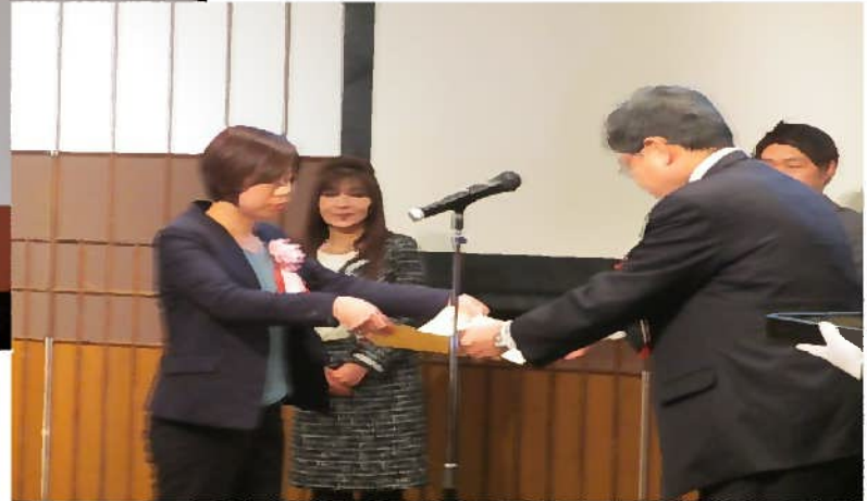
生産・教育・食品産業の3部門 で各2団体で計6団体が受賞