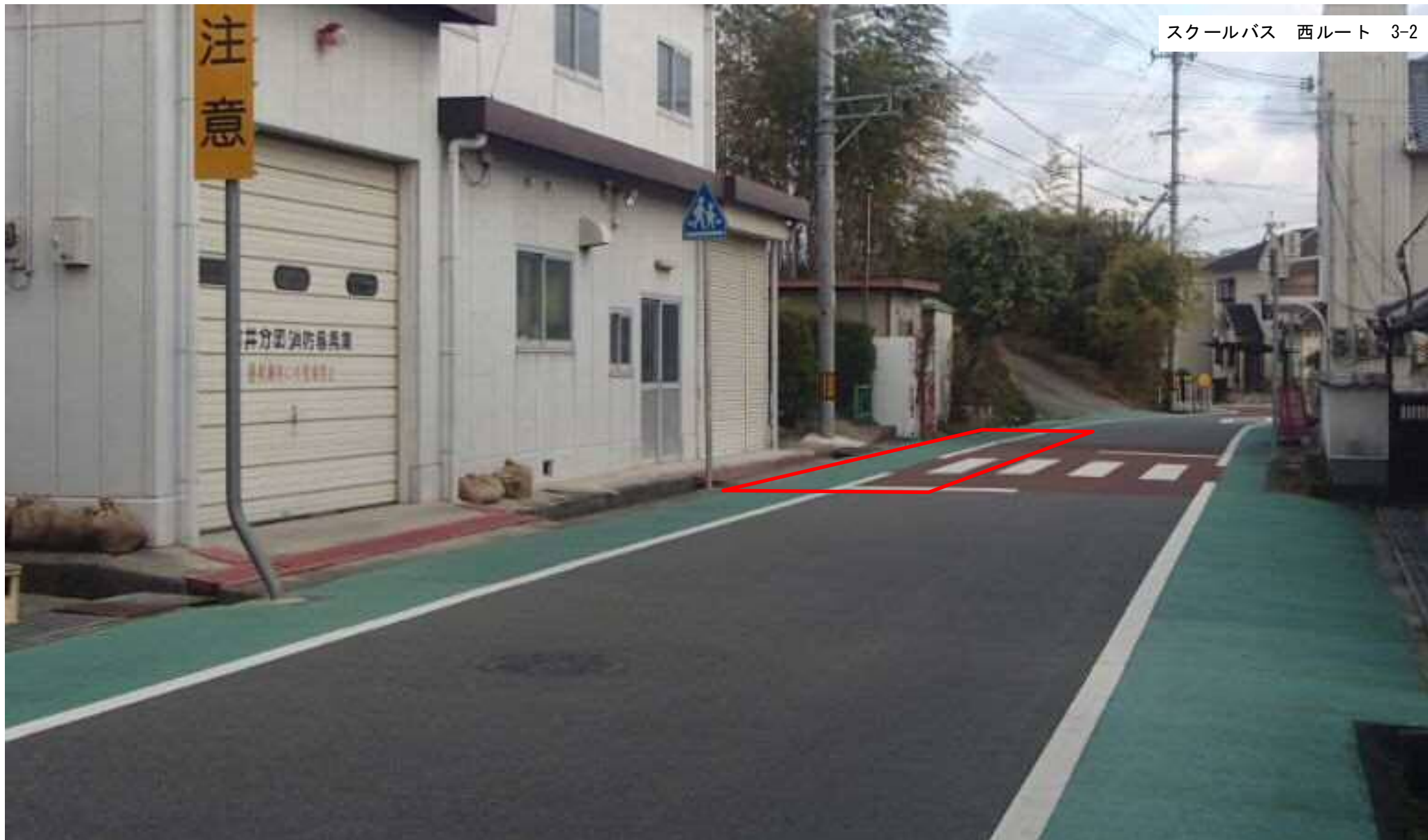
東条西小学校通用門前