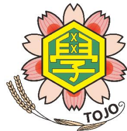
【選定されたデザインをもとに作成された校章】

加東市花がコスモス、市木が桜のため、それぞれの花卉をデザインに入れました。また、名産品である山田錦をモチーフとしたデザインをあしらい、緑豊かな東条をイメージして「學」の文字の周りを緑色にしました。