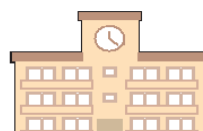
東条学園校舎 【1～9年生】

※開校時に新しい校舎は完成していませんが、校舎完成後に移動します(R3.12 予定)。完成までは、現東条東小学校及び現東条中学校校舎を活用します。