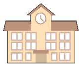
現東条東小学校校舎 【1～6年生】