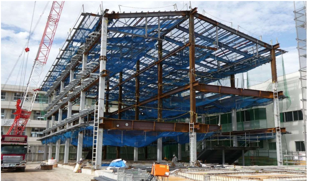
③交流棟 鉄骨建方状況（令和5年8月18日撮影）