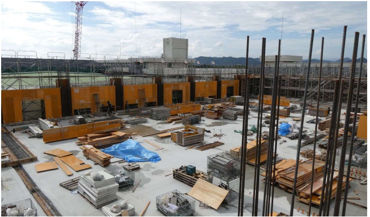
①体育館棟 3階 壁型枠建込状況（令和5年8月18日撮影）