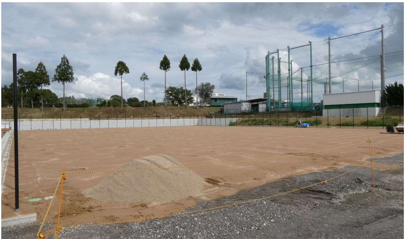
④テニスコート整備状況（令和5年8月18日撮影）