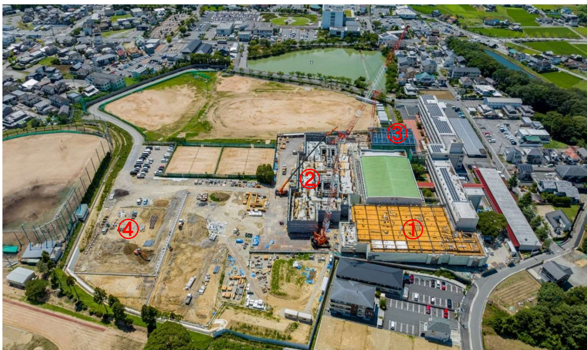
全景 東側上空から撮影（令和5年7月31日撮影）

その次のページ上段③は、交流棟の写真です。屋根まで鉄骨の柱・梁が立ち上がりました。下段の写真④は、新しいテニスコートを整備しています。予定では9月中旬頃、中学校の部活で使用できるようになります。