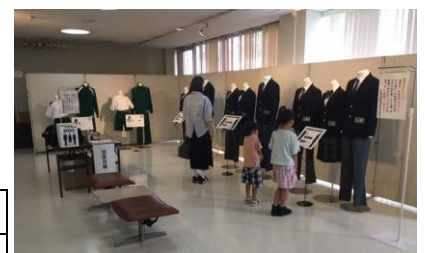
〈社公民館での投票の様子〉

制服の胸には刺繍入りのワッペンが、体操服の胸とカバンには、決定したデザインプリントが入ります。半袖の白の体操服には、長袖のデザインの色を反転したものが入ります。