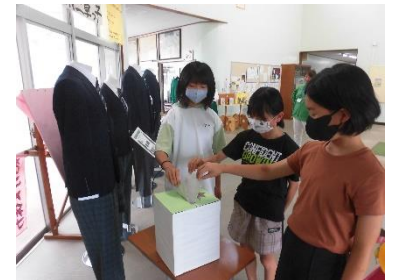
〈小学校での投票の様子〉