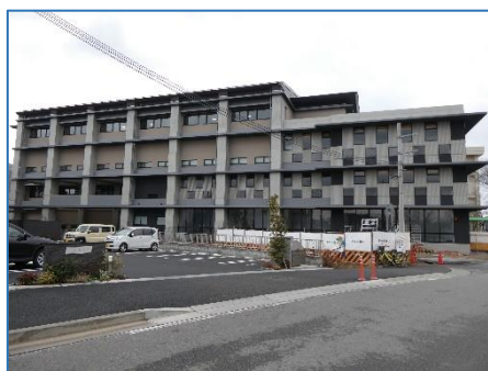
【体育館の外観（東側）】

また、1月19日（金）には、新しい体育館で社中学校入学説明会が開催されました。社地域5小学校の6年生の子どもたちは、広い体育館に驚きの声をあげるとともに、4月から始まる中学校生活に期待を膨らませていました。その後の部活動見学会でも、6年生の子どもたちは、新しい体育館でいきいきと活動する中学生の姿に熱い視線を送っていました。新しくできた体育館を紹介します。