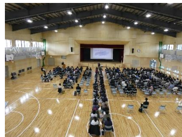
【社中学校入学説明会】

令和5年12月末に、社地域小中一貫校の体育館が完成しました。社中学校では、3学期から新しい体育館で、体育の授業や部活動を行っています。社中学校の生徒からは、「体育館が前よりも広くてきれいになったのでうれしいです。」「これまでは、部活動をするときは、男女で分け合って活動していたけれど、大体育館と小体育館が使えるようになったので、練習しやすくなりました。」等の感想を聞くことができました。