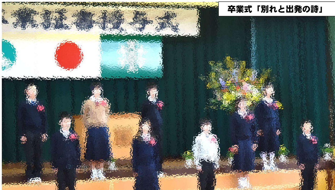
卒業式「別れと出発の詩」

最後に臨時休校という大波乱のあった、令和元年度が終わりました。この1年間、保護者や地域の皆様には、学校教育へのご理解とご支援・ご協力をいただき本当にありがとうございました。何よりも、子どもたちに大きな事故や事件がなかったことに安堵しています。様々なところで、子どもたちを見守り支えていただいたことに深く感謝申し上げます。