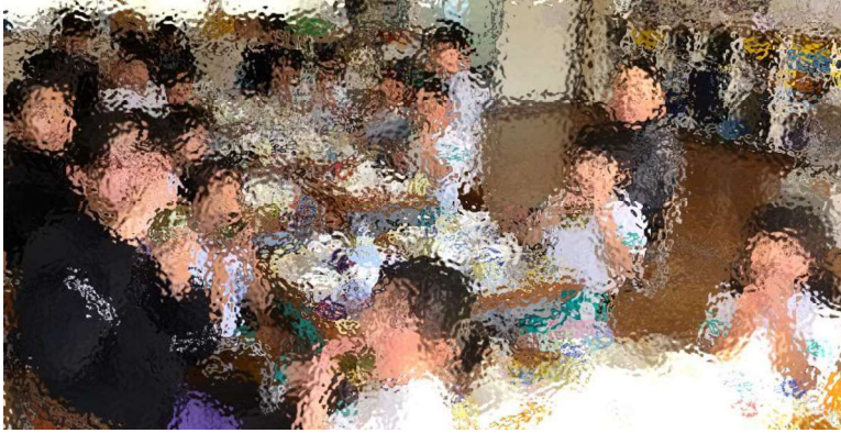
1年生の世話(巻寿司給食)