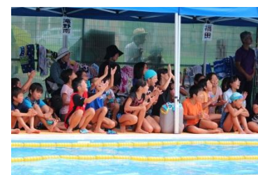
（5年生 友達への応援）