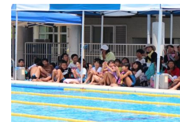
（6年生 友達への応援）