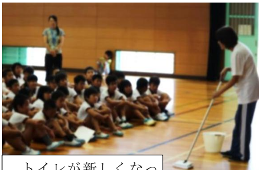
トイレが新しくなって、掃除の仕方も変わります。説明しています。

いよいよ、 17日(土)が運動会 。南っ子はともに挑んでいるかな？という視点でもご覧ください。スローガンは「挑む心よ 燃えあがれ」。皆さまのお越しを心よりお待ちしております。