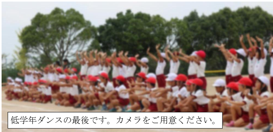
低学年ダンスの最後です。カメラをご用意ください。

子どもたちも同じです。運動会を心から楽しみにしている子も、楽しみと不安が入り混じっている子も、本当は嫌なだけけれど頑張らなくては仕方ないと思っている子もいます。