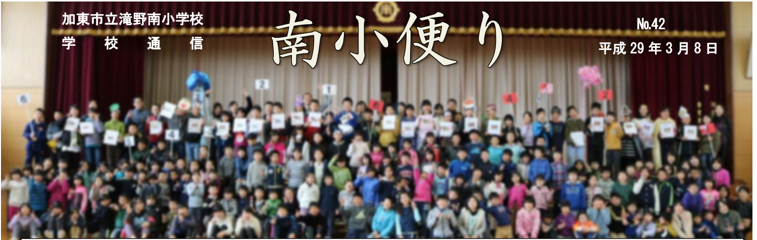
3月3日、 6年生を送る会 。みんなで最後の記念撮影。とっても楽しい会になったけれど、少しさびしいです。

温かい「 6年生を送る会 」になりました。各学年の出し物に込められた、「お世話になりました。ご卒業おめでとうございます。中学校でもがんばってください。」という気持ち。後輩たちが心を込めて頑張る姿を見る6年生の目の優しいこと。初めて学校の中心となって準備を進め、一生懸命に本番を盛り上げてくれた5年生。一つが終わり、一つが始まる、そんな節目をみんなで祝うことができました。6年生は、もうすぐ卒業生と呼ばれます。後輩たちの思いを力にして、ともに挑んでくださいね。