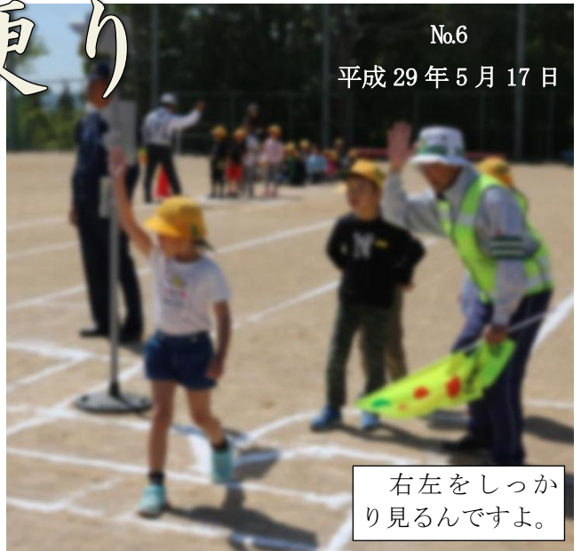
右左をしっかり見るんですよ。

先日の PTA 評議員会でお話したことを、もう一度ここでお話します。4月は、新しい環境の中で、いろんな活動の中を走り抜けてきました。それが、連休で心も体も一休み。さて、連休明け。再始動と思っても、なかなか心に火がともらず、体が動かないということはよくあることです。大人だけでなく、子どもにもそんなことは起こるようです。今まで乗り越えてきた ハードル が跳び越えられなくなって、その次にあるハードル、その向こうにあるハードルを見つけるようにもなります。そうすると、ますます心も体も動かなくなります。ハードルを取り除いてしまうことは、その子にとっても周りの子どもたちにとってよくないことがありますので、ハードルを少し下げてやったり、違う跳び越し方を教えてやったりしながら、その子に強さと自信をもたせてやりたいものです。それは、皆さんと学校が相談しながら進めていかなければなりません。子どものこと、学級のこと、気になることがあれば、学校にお話し下さい。