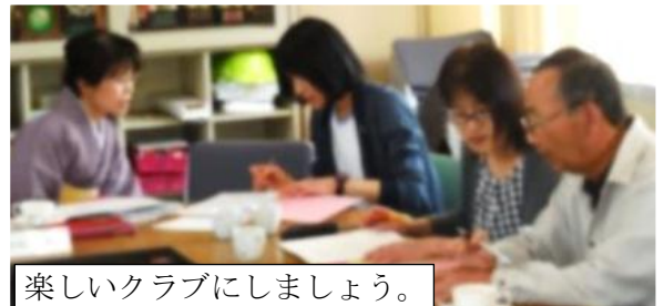
楽しいクラブにしましょう。