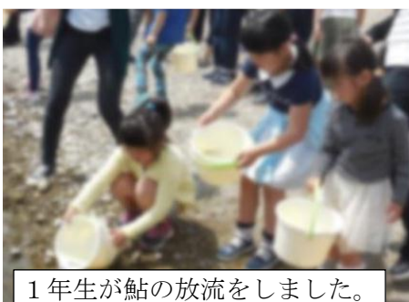
1年生が鮎の放流をしました。