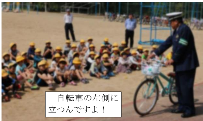
自転車の左側に立つんですよ！

クラブ活動 の打ち合わせ会と、 ふるさと体験学習 の打ち合わせ会がありました。クラブ活動は、先週第1回目を行いました。