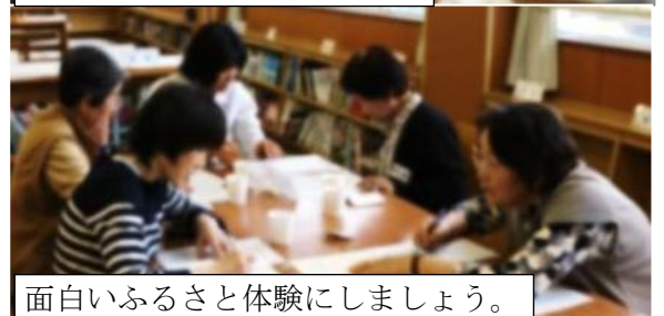
面白いふるさと体験にしましょう。