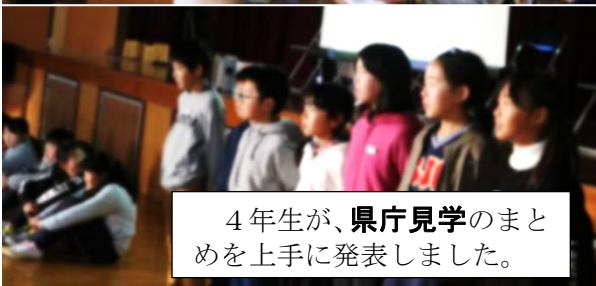
4年生が、 県庁見学 のまとめを上手に発表しました。