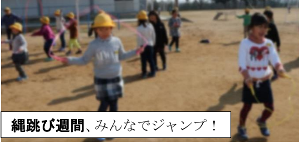
縄跳び週間、みんなでジャンプ！