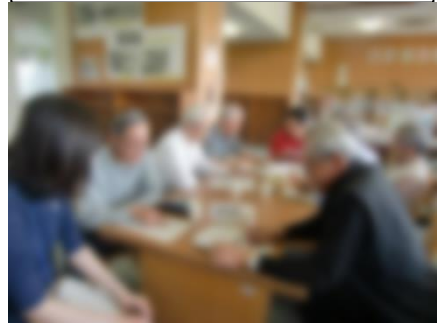
ふるさと体験学習打ち合わせ会の様子