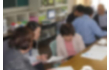
クラブ活動打ち合わせ会の様子