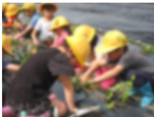
さつまいもの苗を植えました。たくさんとれますように！