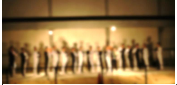
お父さん方の出し物。今年もすごかったです。見事なラインダンスの後、6年担任とのまたまた見事なコラボでした。