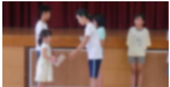
健康委員会より「給食の後片付け、残菜調べ」1位2年生、2位4年生、1年生 図書委員会より「読書月間の目標達成率」1位1年生、2位6年生の表彰がありました。毎日続けた結果です。頑張っていることは大切ですね。素晴らしいことですね。