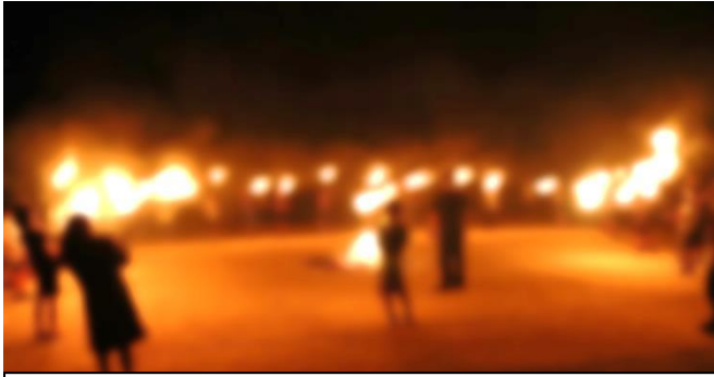
6年生 PTCA キャンプがありました。トーチ棒に点火され赤々と燃える炎。とても美しかったです！