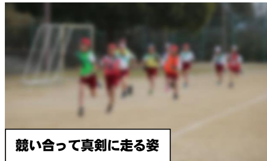
競い合って真剣に走る姿