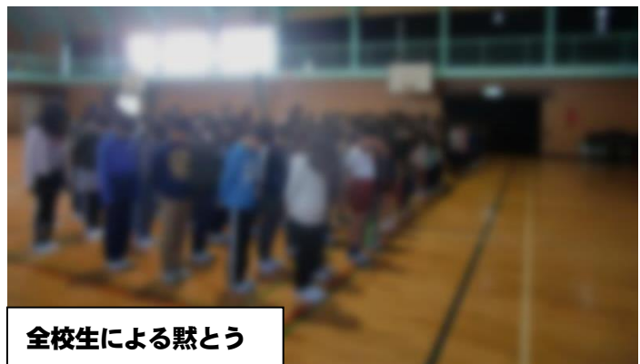
全校生による黙とう

阪神・淡路大震災により、助け合うことの大切さや生きることの意味などを考えさせられました。自分の命は自分で守る。このことを学ぶきっかけにもなりました。今後、南海トラフ地震が起こるとも言われています。「備える」、「伝える」を続けていきたいものです。