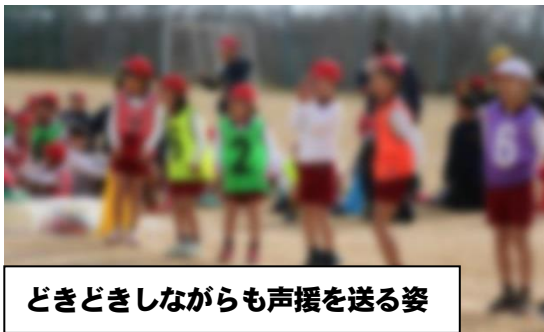
どきどきしながらも声援を送る姿

子どもたち一人一人、低学年はリングバトンを、高学年はたすきを次につなぐため、走りぬきました。得意な子も苦手な子も、チームの一員として、自分の役割を果たすことができました。それから、走りだけでなく、熱い応援が素晴らしかったです。子どもたちにとって、達成感とともに一体感を味わうことのできた大会となりました。順位は、低学年の部と高学年の部の合計タイムで決まります。赤6班、おめでとうございます！