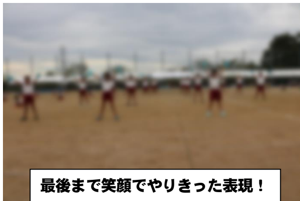
最後まで笑顔でやりきった表現！

に終わることができ、感謝の気持ちでいっぱいです。ありがとうございました。今後とも本校の教育活動へのご支援・ご協力のほど、よろしくお願いいたします。