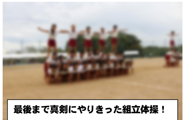
最後まで真剣にやりきった組立体操！