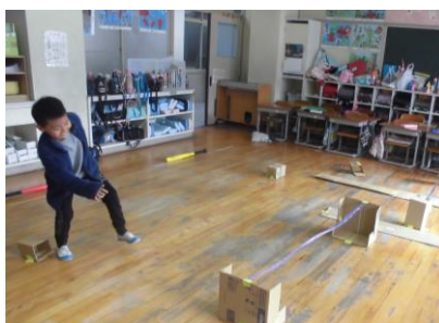
しょうがいぶつレース

小鳩班の班員は、1年間で春の遠足、小鳩班遊び、廊下そうじ・草引き等の活動を通して、とても仲良くなりました。