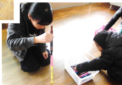
ブロックイー立て

小鳩班の班員は、1年間で春の遠足、小鳩班遊び、廊下そうじ・草引き等の活動を通して、とても仲良くなりました。