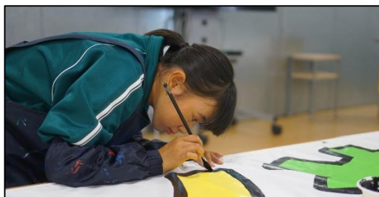
☆2年生 ものづくり体験学習☆