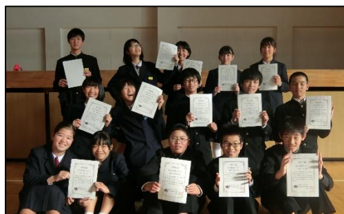
～2学期 挨拶マスター～

さて、3学期は締めくくりの学期であり、次年度へ向けての準備期間の学期でもあります。1年生は「スキー教室」へ向けて「凡事徹底～今の自分にプラスワン」の目標を掲げて取り組んでいます。2年生は「大阪校外学習」へ向けて「チャイム着席」と「授業の挨拶」を班で点検する活動に励んでいます。そして3年生は「受験は団体戦」をキーワードに、面接練習や過去問に繰り返し挑戦しています。このような大切な行事やテストになればなるほどその集団や人が持つ習慣が顕著に表れます。私も大切な時に、「日ごろからここを意識してきた良かった」とか、逆に「あー、こういうことをしておけば良かった」ということが山ほどあります。何がどうなったら成功という具体的な目標をイメージし、そのために今必要なことが何なのかを学年やクラスでもう一度確認しましょう。そして、「今日はできたかな」と振り返りながら、毎日の生活を送ることが大切です。その積み重ねが、4月からの新年度へとつながっていきます。そのためにも、夢を追い、挑み続ける全ての生徒に教職員、保護者、地域の方たちでエールを送り続けましょう。みなさん、今年もどうぞよろしくお願いいたします。